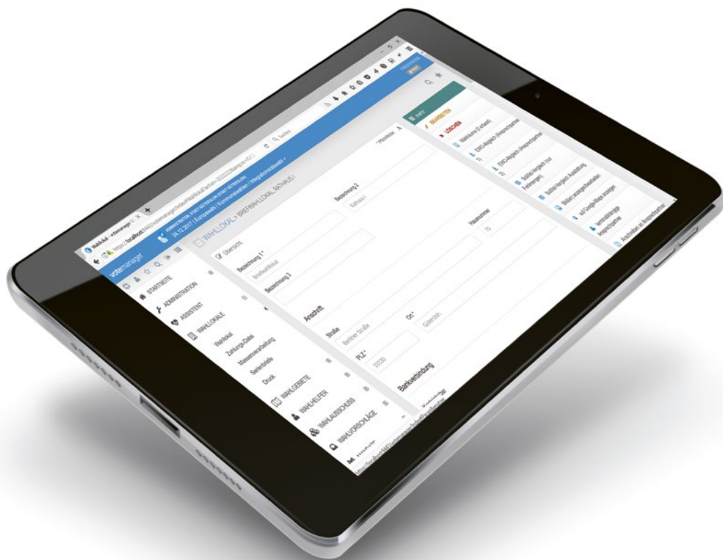
votemanager auf mobilen Endgeräten

Auch im BSI-zertifizierten Rechenzentrum der ekom21 steht das Thema Sicherheit ganz oben auf der Agenda - mit moderner Technik (Server, Firewalls, Revers Proxies usw.) in verschiedenen Sicherheitszonen. Zudem sorgen redundante Systeme und eine permanente Überwachung für einen unterbrechungsfreien Betrieb