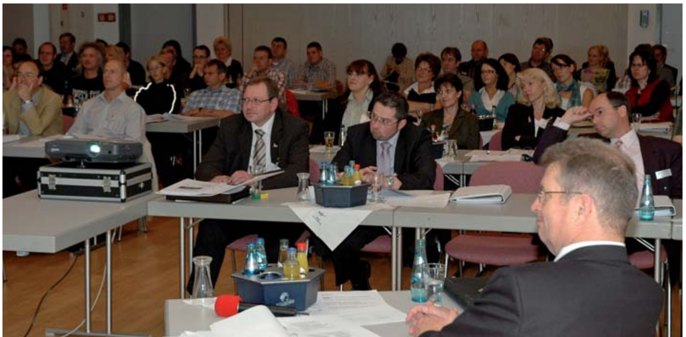
Voll besetzte Reihen auch in Wetzlar