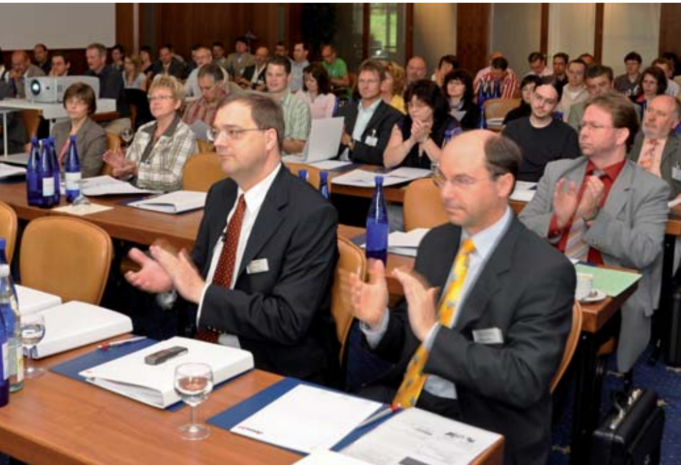
An allen Infotagen (hier in Kassel) herrschte große Resonanz

Die Veranstaltungen wurden von nahezu allen Teilnehmern positiv bewertet. Sie haben diesen Tag auch für Gespräche und zum Erfahrungsaustausch genutzt. Aufgrund dieser positiven Resonanz werden wir diese Veranstaltungen auch in 2010 fortführen. Schon jetzt sind alle nsk-Anwender dazu herzlich eingeladen.