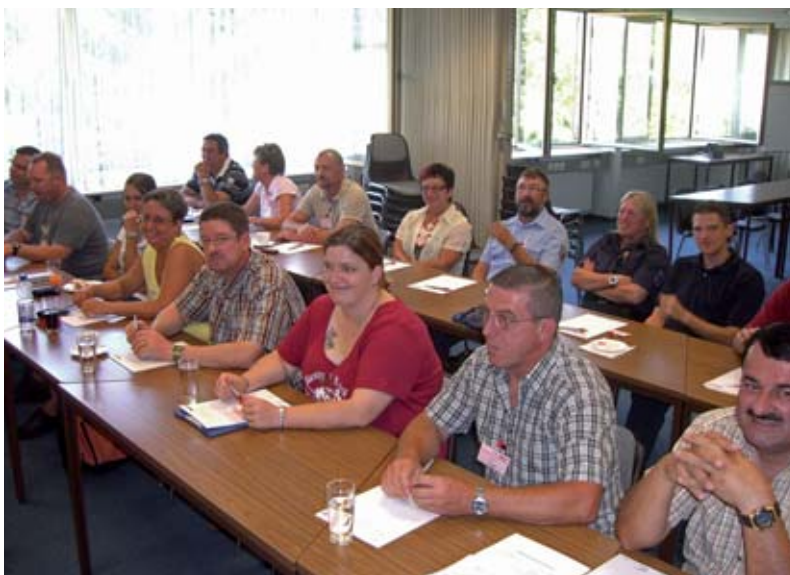
Bei den owi21ToGo-Anwendertreffen (wie hier in Gießen) wurden zahlreiche Neuerungen vorgestellt