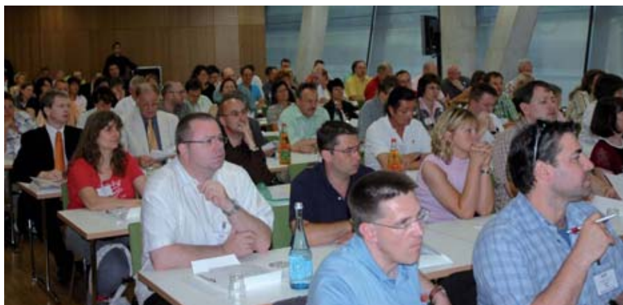
Auch in diesem Jahr war die Resonanz wieder hervorragend

Am Beginn der Infotage stand der Vortrag „Doppik – Einführung Hessen: wie geht es mit newssystem® kommunal weiter?“ von Armin