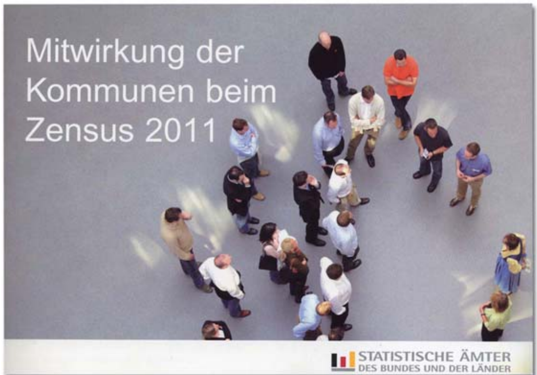
Informationsbroschüre der Statistischen Bundes- und Landesämter zum Zensus 2011

Neben den vorbereitenden Arbeiten in den Jahren 2008 bis 2010 werden die Kommunen verstärkt im Jahr 2011 zur Unterstützung des Zensus gefordert sein. In 2011 sollen nach den derzeitigen Planungen drei Lieferungen