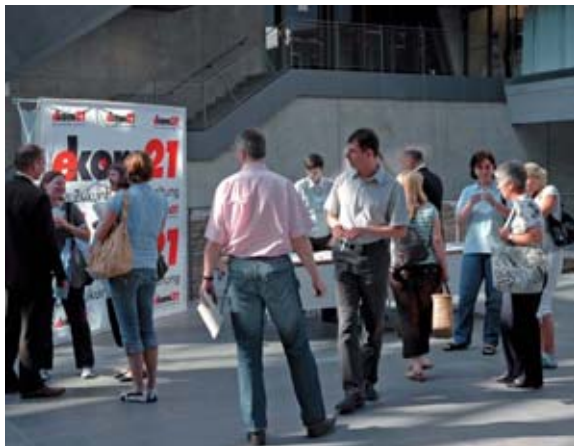
Die Infotage wurden auch zum Erfahrungsaustausch unter den Teilnehmern genutzt

Nach der Premiere in 2007 hat die ekom21 auch in diesem Jahr ihre nsk-Anwender zu regionalen Infotagen eingeladen. Waren beim Auftakt noch 83 Kommunen mit insgesamt 181 Mitarbeiterinnen und Mitarbeitern der Einladung gefolgt, so waren es in 2008 insgesamt 291 Mitarbeiterinnen und