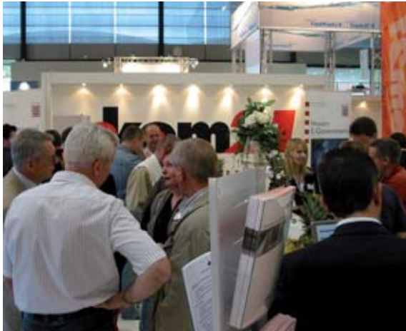
Großer Andrang auf dem ekom21-Stand

Da gab es den einen oder anderen erstaunten Blick von den Nachbarausstellern: So groß war der Andrang auf dem ekom21-Stand während der KOMCOM Süd in Karlsruhe. Am 6. und 7. Mai 2008 präsentierte sich die ekom21 auf ihrem 100 qm großen Stand mit einer ganzen Reihe von Lösungen zu den Themen Personenstandswesen, digitale Archivierung, kommunales Finanzmanagement, Kfz-Zulassungswesen, Friedhofsverwaltung, mobiler Bürgerservice sowie mobile Erfassung von Ordnungswidrigkeiten.