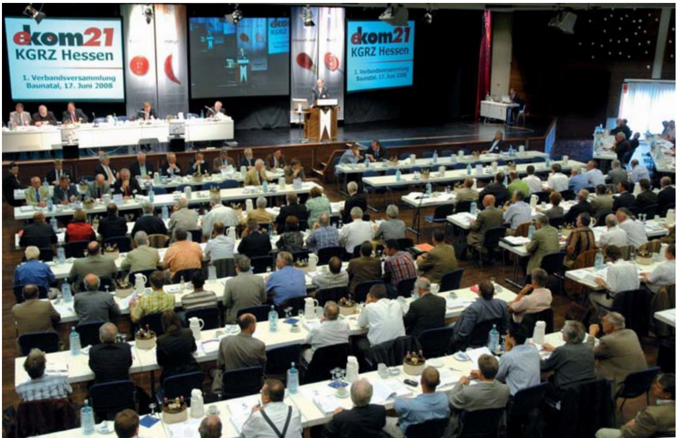
Konstituierende Sitzung am 17.06.2008 in Baunatal: Die Mitglieder der 1. Verbandsversammlung der ekom21 – KGRZ Hessen

Auch im Bereich „Ordnungswidrigkeiten“ konnte mit dem eigen entwickelten Verfahren