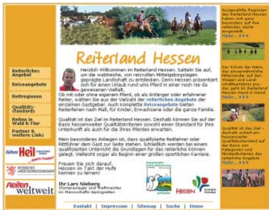
Fundierte Informationen und ansprechendes Design: Die Gestaltung kommt von der ekom21

Wer sich selbst davon überzeugen möchte, für den ist ein Besuch auf den Internetseiten www.reiterland-hessen.de lohnenswert. ■