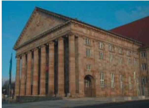
Kongress Palais Kassel: Dank der ekom21 sind nun historisches Ambiente und moderne Technologie vereint

Die Benutzer können sich nun innerhalb einer großen Reichweite frei bewegen, ohne dass die Netzwerkverbindung abreißt. Die Access Points wurden nämlich so angebracht, dass sich die Sendeleistung überschneidet.