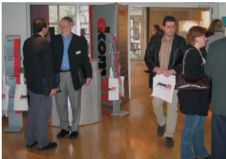
Reger Andrang zur ekom21-Informationsveranstaltung